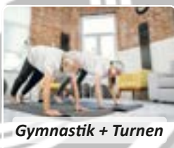
Gymnastik + Turnen